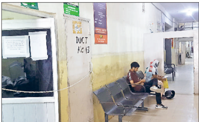
सोनीपत। नागरिक अस्पताल का एक्स-रे रूम।

जिला नागरिक अस्पताल में मरीजों को बेहतर स्वास्थ्य सेवाएं देने के दावे एक बार फिर खोखले साबित हो रहे हैं। अस्पताल में पिछले 12 दिनों से डिजिटल एक्स-रे मशीन खराब पड़ी है, जिसके चलते मरीजों को भारी परेशानी का सामना करना पड़ रहा है। एक्स-रे सेवा बंद होने के कारण मरीजों को मजबूरन निजी लैबों में जाकर महंगे दामों पर जांच करानी पड़ रही है। जानकारी के अनुसार, जिला नागरिक अस्पताल की ओपीडी में रोजाना लगभग दो हजार से अधिक मरीज इलाज के लिए पहुंचते हैं। इनमें से करीब 100 मरीजों को एक्स-रे की आवश्यकता होती है। लेकिन 17 अक्टूबर से मशीन के कंप्यूटर सिस्टम में आई तकनीकी खराबी के चलते एक्स-रे सेवा पूरी तरह ठप है। परिणामस्वरूप मरीजों को या तो जांच के बिना लौटना पड़ रहा है या फिर निजी अस्पतालों में जाकर जांच के लिए अधिक पैसे खर्च करने पड़ रहे हैं।