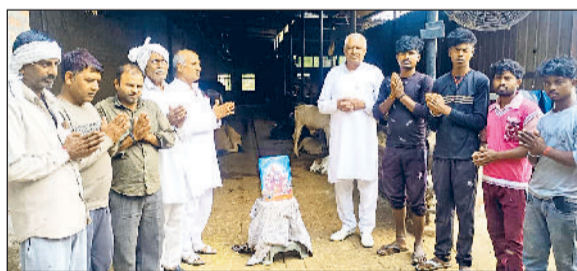
गोहाना। भगवान श्रीकृष्ण को नमन करते हुए गोभक्त।