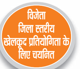
विजेता जिला स्तरीय खेलकूद प्रतियोगिता के लिए चयनित