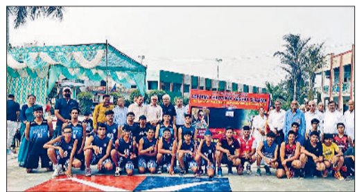
सोनीपत। खिलाड़ियों के साथ अतिथिगण साथ में स्कूल प्रबंधन सदस्य।