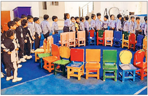
सोनीपत। म्यूजिकल चेंबर में खेलते बच्चे।