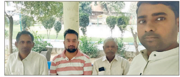
सोनीपत। नगर निगम में पहुंचा शिफ्टमंडल।