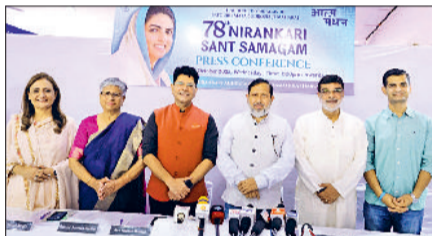
गन्नौर। प्रेसवार्ता के दौरान जानकारी देते संत निरंकारी मंडल के प्रेस एवं पब्लिसिटी विभाग के सदस्य।