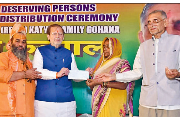
गोहाना। पात्र महिलाओं को चेक देते हुए मंत्री डॉ. अरविंद शर्मा।

सहकारिता, कारागार, निर्वाचन, विरासत व पर्यटन मंत्री डॉ. अरविंद शर्मा ने कहा कि भाजपा सरकार मुख्यमंत्री नायब सिंह सैनी के नेतृत्व में सेवा भावना के लक्ष्य के साथ गरीब, वंचित व पात्र परिवारों के उत्थान को समर्थित है। इसी कड़ी में सामाजिक, धार्मिक संगठनों के साथ-साथ अच्छी भावना के साथ सेवा भाव दिखाने वाले समाजसेवियों के प्रयासों से भी