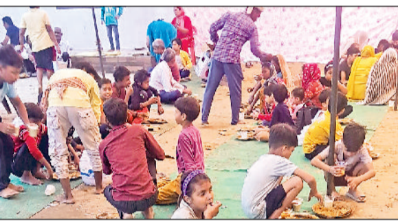
खरखोदा। भंडारे में प्रसाद ग्रहण करते श्रद्धालुगण।